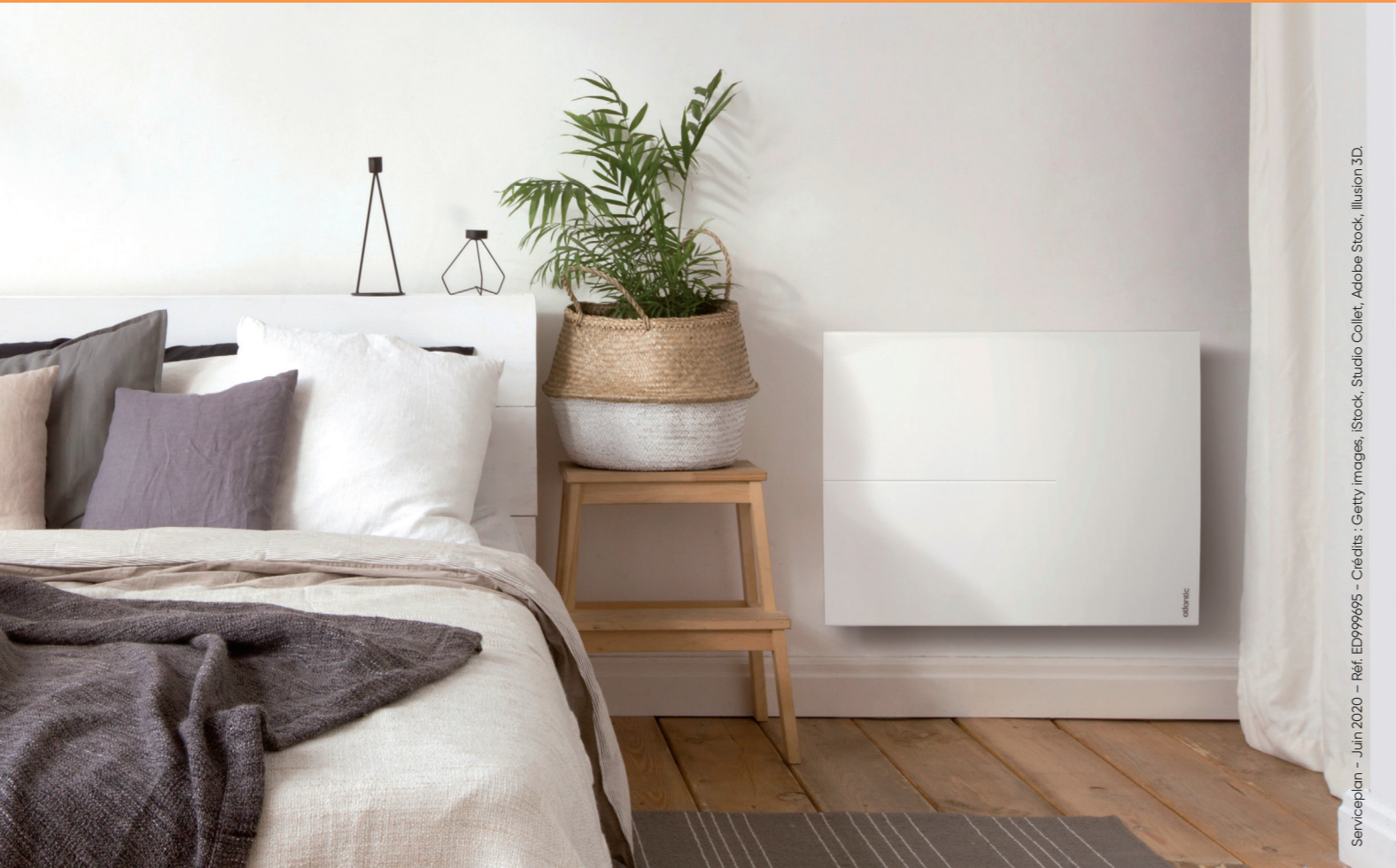
Serviceplan - Juin 2020 - Réf. ED999695