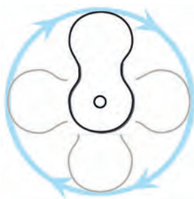
Grille orientable à 360°